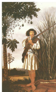
1) Mulato - 1641

Olhando as imagens abaixo de pinturas de estilos variados, relacione as pinturas de cada uma das imagens ao respectivo autor.