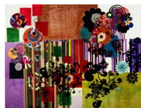
5) Avenida Brasil – 2003-2004