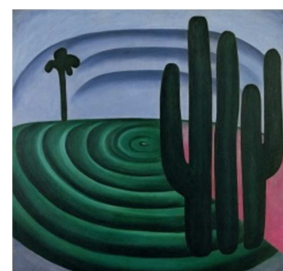
3) Distância – 1928