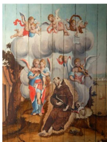
2) São Francisco de Assis Agonizante S/D sacristia da Igreja da Ordem Terceira de São Francisco de Assis.