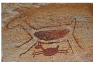
4) Símbolo do PARNA da Serra da Capivara